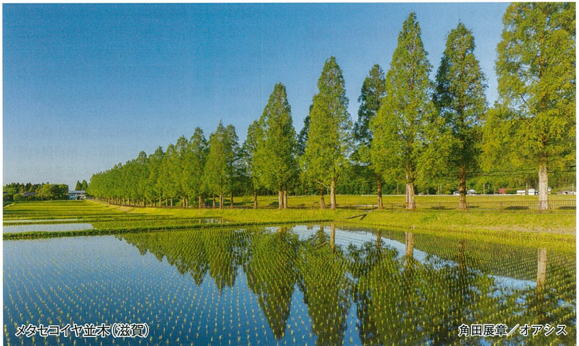
メタセコイヤ並木(滋賀)