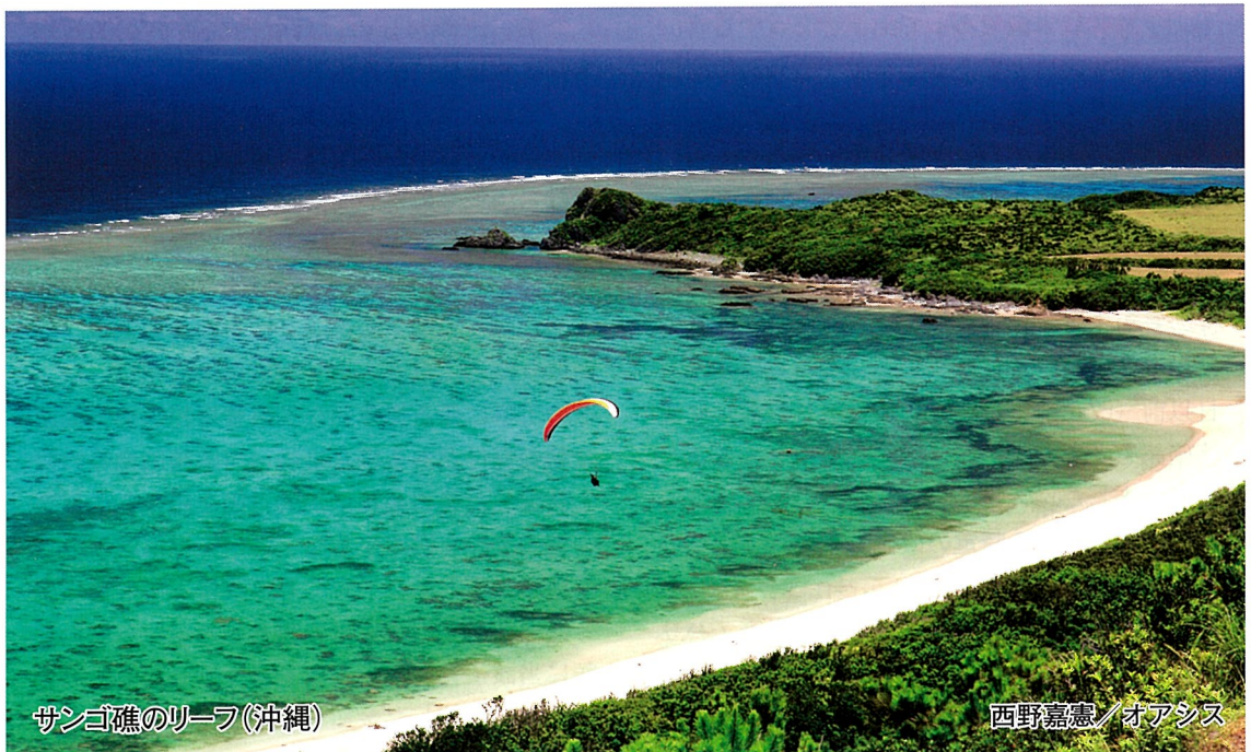
サンゴ礁のリーフ(沖縄)